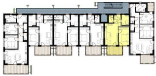
Übersicht 2. Obergeschoss